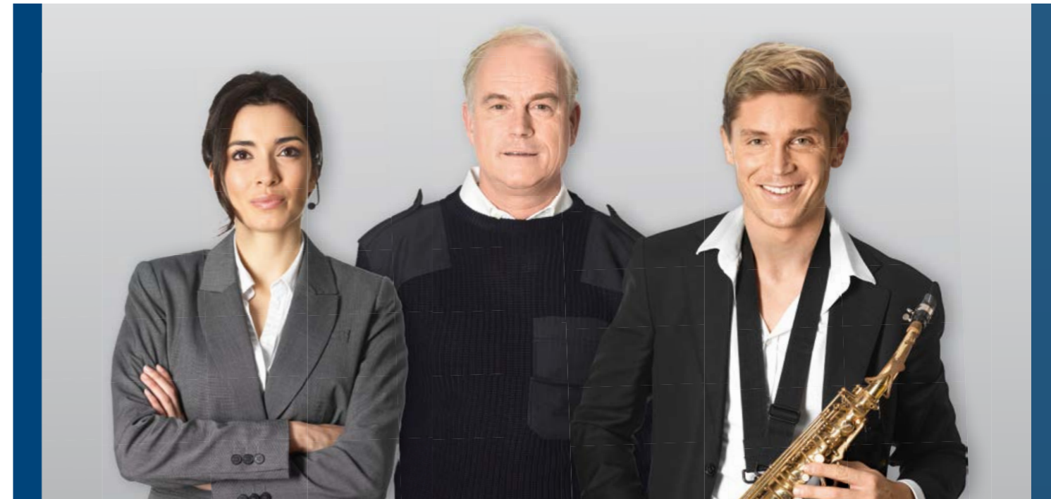
PAVIRO: megafonía, evacuación por voz, calidad de sonido profesional

El mejor de su clase Gracias a su potente conjunto de funciones, PAVIRO no solo satisface una amplia variedad de requisitos de aplicaciones, sino que también ofrece un rendimiento excepcional en calidad, facilidad de instalación y versatilidad. Al mismo tiempo, permite minimizar los costes operativos gracias a su bajo consumo energético y menor uso de baterías.